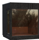
Kirami FinVision® -lounge M Misty, (Left) 1 Tür