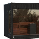
Kirami FinVision® -sauna M Misty (Left), Harvia Virta Combi 10,8 kW