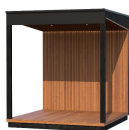
Kirami FinVision® -Terrasse M Misty