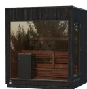
Kirami FinVision® -sauna M Misty (Right), Harvia Virta Combi 10,8 kW